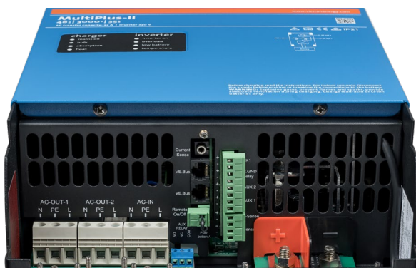
Área de conexión